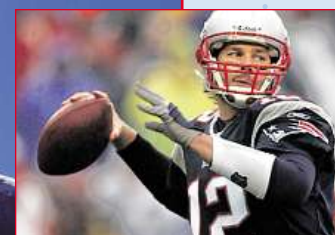
■ Tom Brady